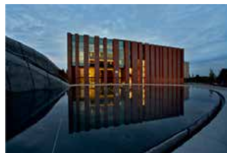
SIEDZIBA NARODOWEJ ORKIESTRY SYMFONICZNEJ POLSKIEGO RADIA

Uroczysta Gala i Bal Firm Rodzinnych 12.10.2018