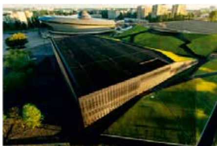
MIĘDZYNARODOWE CENTRUM KONGRESOWE

„Śląski” Wieczór integracyjny Konferencja 11-13.10.2018