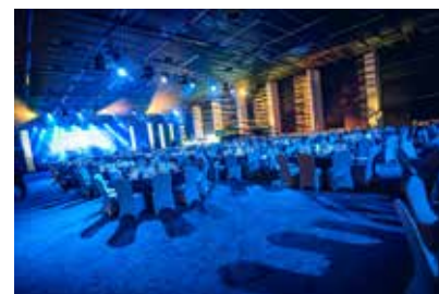
Sale balowe MCK w Katowicach

BĄDŹ Z NAMI PODCZAS NAJWIĘKSZEGO W POLSCE WYDARZENIA SKUPIAJĄCEGO POLSKIE FIRMY RODZINNE!