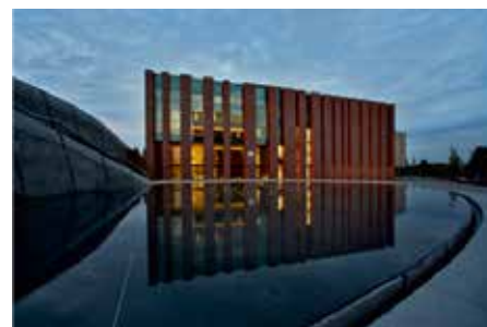
SIEDZIBA NARODOWEJ ORKIESTRY SYMFONICZNEJ POLSKIEGO RADIA

Uroczysta Gala i Bal Firm Rodzinnych 12.10.2018